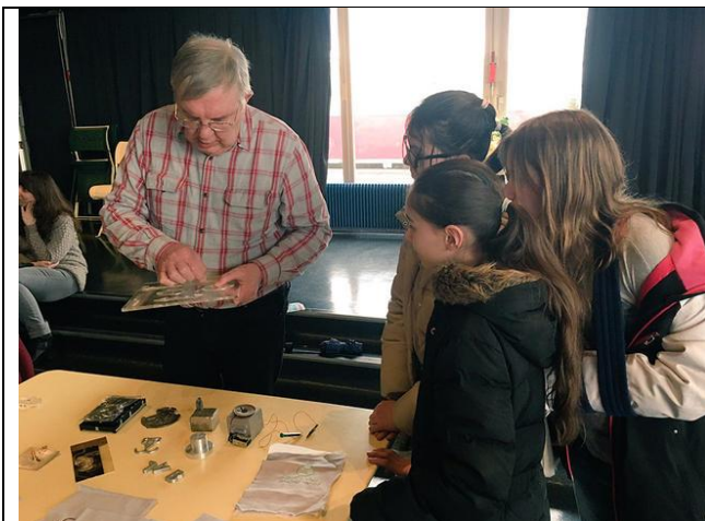
Initiation à l'électronique à destination du jeune public, à l'Electrolab de Nanterre.