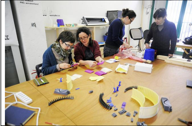
Assemblage d'une machine à tricoter contrôlée par ordinateur, construite avec une imprimante 3D et une machine à découpe laser (Fablab Wemake, Milan).