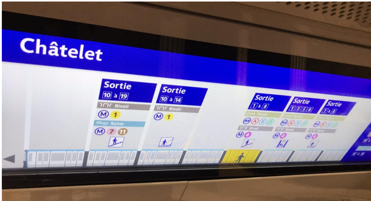
Figure 1 Ecran adaptatif informant le passager dans une rame de la ligne 14 à la station Châtelet

La photo suivante a été prise dans une rame de dernière génération circulant sur la ligne 14. Il s'agit d'un affichage qui s'adapte en fonction de l'endroit où est positionné l'écran dans la rame (ie. File de wagons connectés).